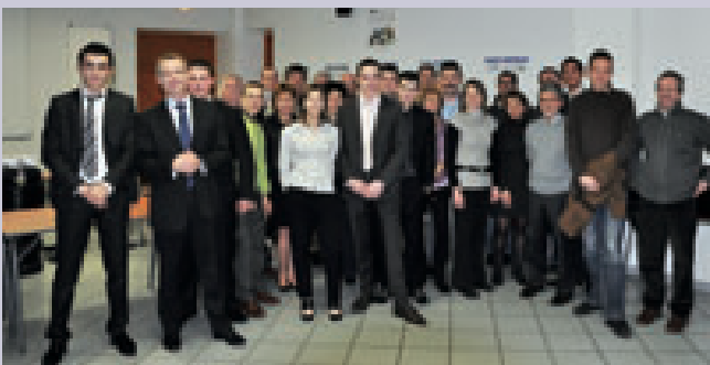
La «promotion Vendeurs conseil» du groupement France Matériaux.