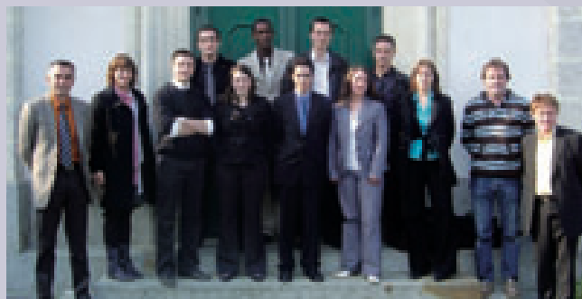
La «promotion Vendeurs conseil» du négociant Tout Faire Ajimatériaux.