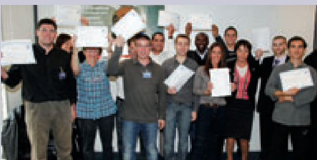
Cérémonie de remise des titres au sein de l'école Point P.